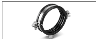
NORMAFIX® Schallentkoppelte Befestigungsschelle

NORMAFIX® Befestigungsschelle ist Teil eines breiten Produktportfolios. Entdecken Sie mehr!