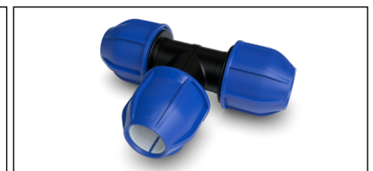
NORMA Klemmverbinder PN16